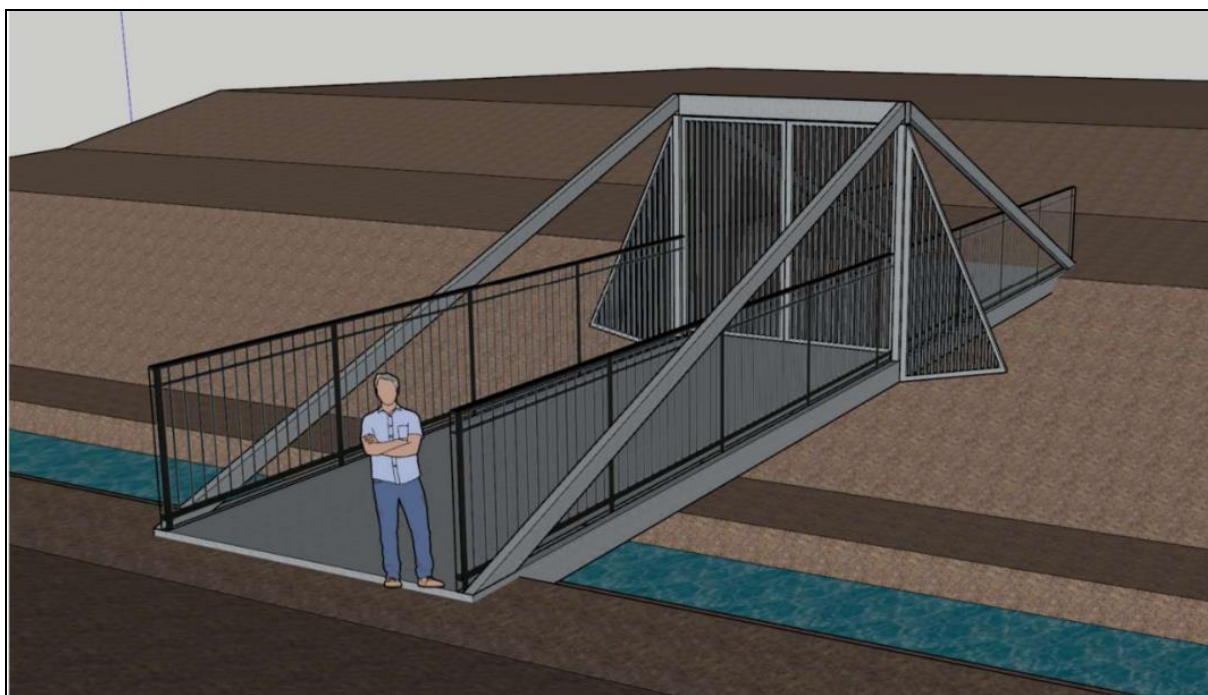
Prinsippskisse av stengt bru

DNT har søkt Statskog om oppføring av ny bru over elva Ula, ved Spranget. Brua vil bli satt på lave fundamenter i høyde med terrenget på samme sted som eksisterende bru. Den eksisterende brua, som eies av Statskog, ble opprinnelig bygd i forbindelse med skiferbruddet på Spranget, som ble drevet før nasjonalparken ble oppretta i 1962. Dette er ei betongbru/ementbru der fundamentet er begynt å rase ut. Statskog ønsker derfor å rive den eksisterende brua. Statskog har bedt om uttale fra Sel Fjellstyre før de tar stilling til søknaden fra DNT.