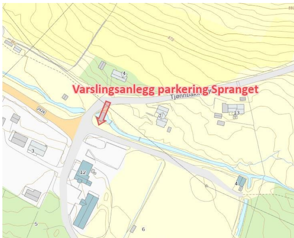
Kart 3 Forslag til plassering av varslingsanlegg for parkeringen på Spranget.

Vedtaket kan iflg. §28 i Forvaltningsloven, påklages. En eventuell klage skal være skriftlig og sendes Sel Fjellstyre innen 3 uker fra mottak av dette vedtak. Partene har rett til innsyn i dokumenter jfr. Forvaltningslovens § 18 og 19.